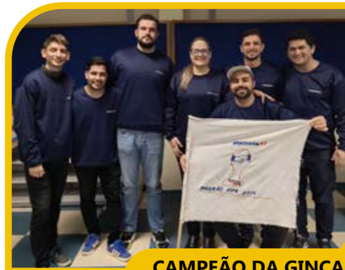
CAMPEÃO DA GINCANA Padrão Fifa

Esse ano a Gincana teve vários motivos para ser realizada: é um ano de retomada, pois vínhamos de uma pandemia de Covid-19 e uma enchente avassaladora, que atingiu muitos funcionários do AtacadãoRS. Essa retomada coincidiu com a comemoração dos 40 anos da empresa! Só temos a agradecer a cada colaborador e a cada parceiro dessa caminhada. Seguimos na certeza que estamos nos empenhando sempre para entregar o melhor aos nossos clientes.