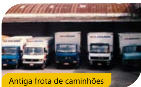
Antiga frota de caminhões