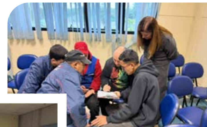
Prova de Conhecimentos Gerais