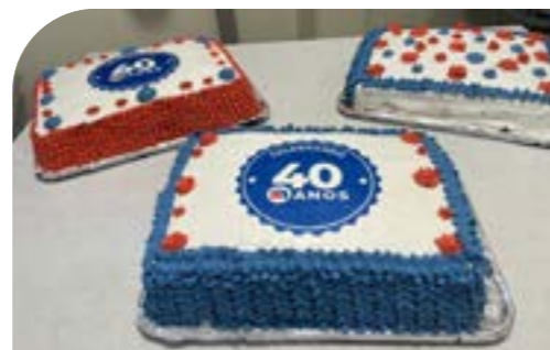
Bolo comemorativo, feito pela equipe da Naturas