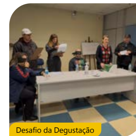
Desafio da Degustação