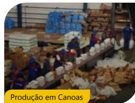
Produção em Canoas