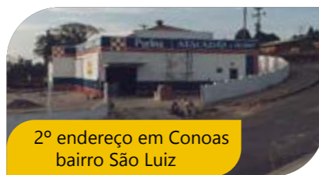
2º endereço em Conoas bairro São Luiz