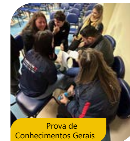
Prova de Conhecimentos Gerais