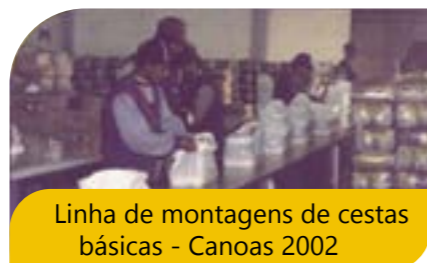
Linha de montagens de cestas básicas - Canoas 2002