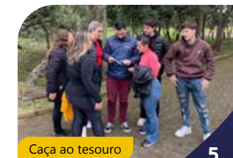
Caça ao tesouro