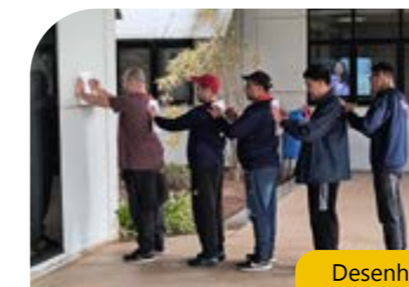
Desenhando nas costas