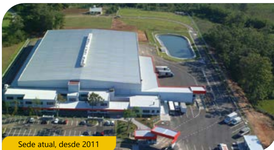
Sede atual, desde 2011