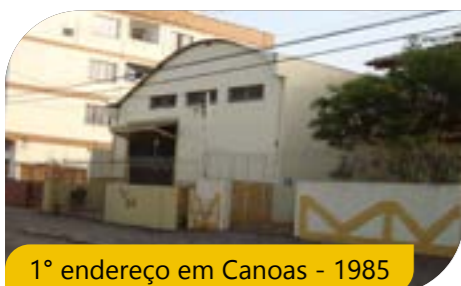
1º endereço em Canoas - 1985